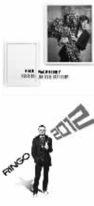
Ringo Starr 《Ringo 2012》