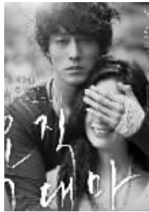
主演: 苏志燮 导演: 宋一坤 韩孝珠

《只有你》讲述的是混过黑道的拳击手哲民,爱上了清纯美丽的盲女贞花,当得知有项昂贵的手术可以令她恢复视力时,他犹豫了。为了筹到足够的手术费,他最终选择了参加非法黑拳比赛,以赢取高额奖金……标榜为催泪大片的《只有你》,其抒情叙事仅仅停留在一个童话层面上,缺乏现实的厚度,仅靠表现男性肉体痛苦的过时方式已经难以打动观众,无法榨取观众的眼泪。好在不同凡响的视觉风格和两位偶像的号召力拯救了影片,该片公映后,观影人次超过了100万,没有让导演太过难堪。