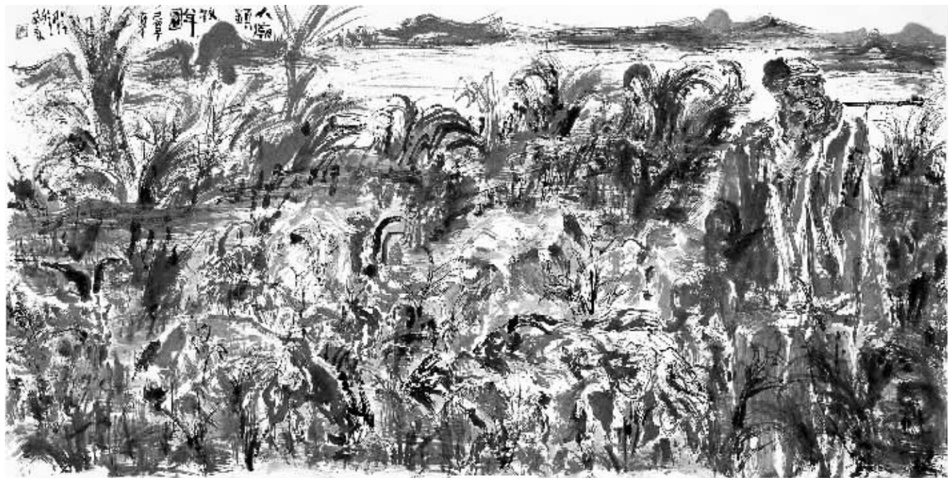
《最后的乡村·大庙镇牧羊图》