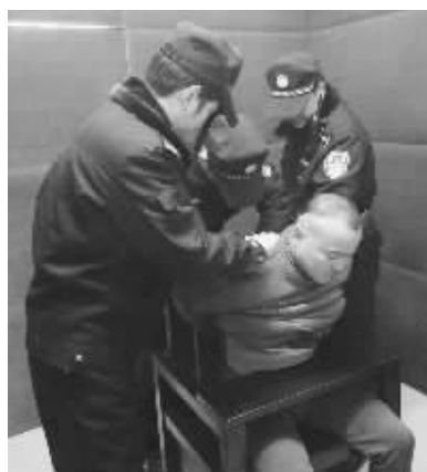
劫匪被抓