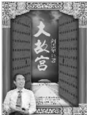
阎崇年 著 长江文艺出版社友情推荐