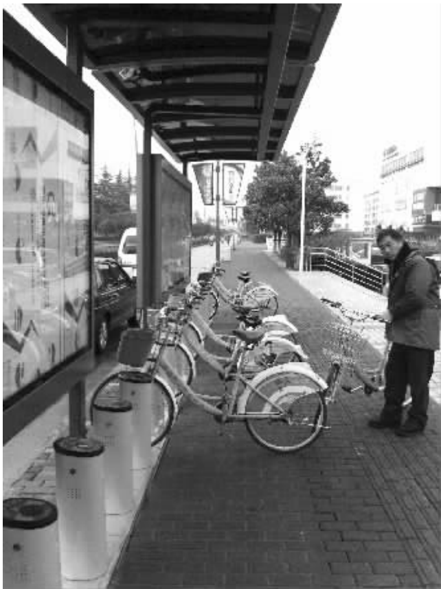
苏州工业园区的公共自行车停放点