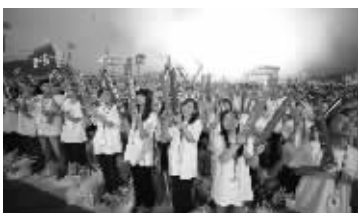
2011年“苏宁之夏”员工文艺晚会

日前,由中国经营报主办的“2011(第二届)企业幸福指数”评选颁奖活动在北京隆重举行。国内家电零售行业领导者苏宁电器在此