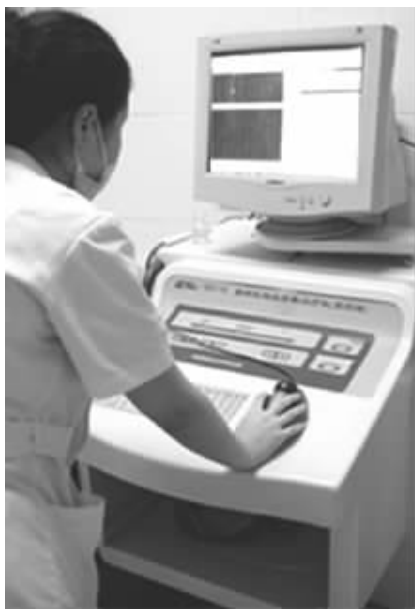
▲金陵男科医院性功能障碍检测与评估中心实验室医师在现场操作

据金陵男科医院20年临床发现,门诊性功能障碍年龄群集中在30~50岁,几年前40岁以上男性患者发病率高达44.8%,2011年这一年龄层次的患者达到77.3%,也就是说性功能障碍的发病率在提升,且日益呈低龄化发展趋势。在治疗方面,性功能障碍因病因复杂,治疗时必须查准病因才能对症治疗,据了解,当前83.4%的性功能障碍患者忽略病因检测。国内性功能障碍专业的检测与治疗源于1992年,当时徐元诚院长审视了医疗格局的走势,成立了全国首家男科医院——金陵男科医院,同时建立了中国首家性功能障碍检测评估中心——金陵男科医院性功能障碍检测与评估中心。