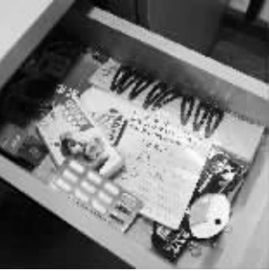
抽屉里,一排发夹还没用过