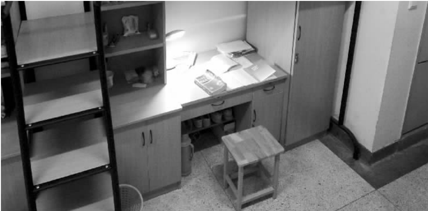
李娟的大学宿舍里，灯亮着，人已去