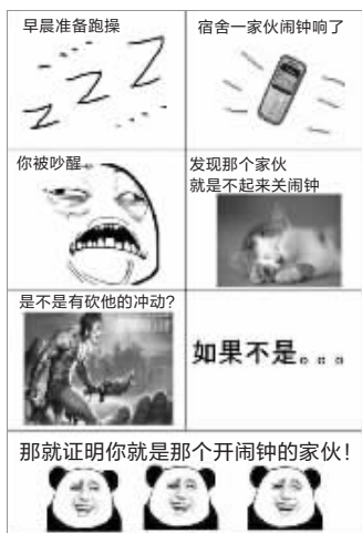
邵陈希画的有关校园生活的漫画