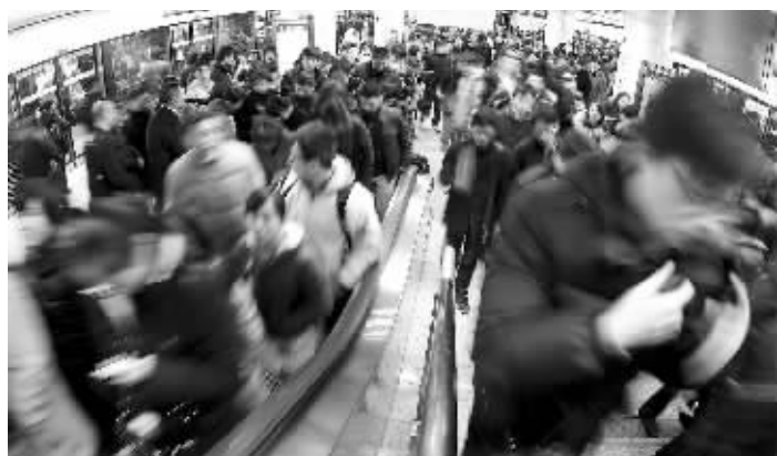
昨天晚上高峰,地铁二号线客流增加不少