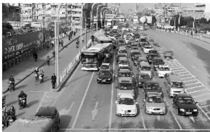
昨日,三山桥上公交专用道被不少小车占据