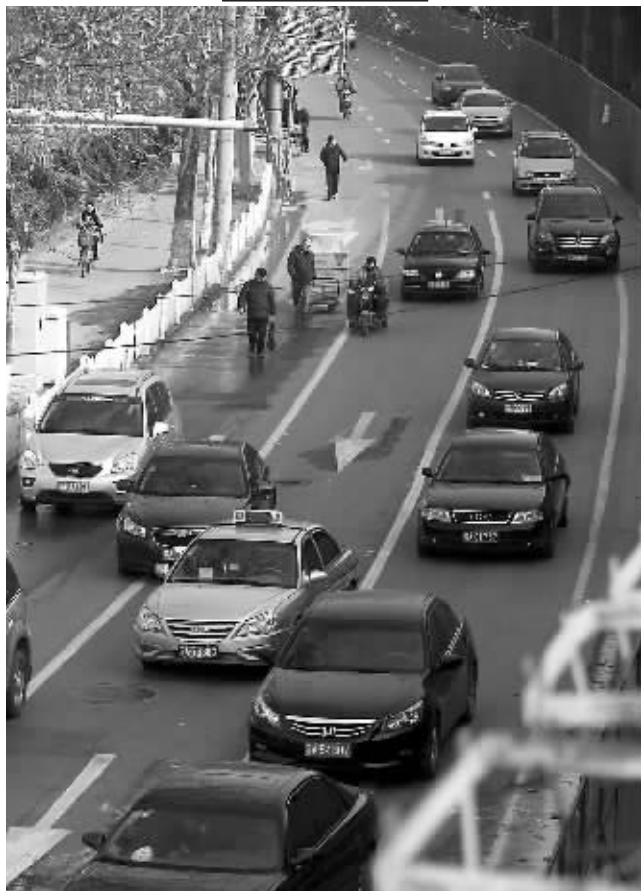
昨天早高峰,城东干道双向拥堵严重,而城西干道水西门高架下围挡施工路段却车行畅通