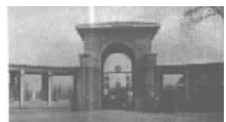
民国时期的南京第一公园