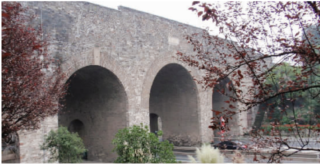
南京有多处以“中山”命名的地名和建筑，“中山门”即是一处