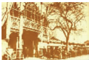
孙中山北京铁狮子胡同寓所

1925年3月12日早晨，59岁的孙中山先生在北京铁狮子胡同寓所逝世。消息传出，举国哀痛。铁狮子胡同的孙中山行馆迎来了众多前来吊唁的中外宾客，据当时的报纸描述，截至当天晚上八点，已有3000多人涌入。时为北洋政府执政的段祺瑞，也显示出了开明大度的一面，下令对孙中山施以国葬。