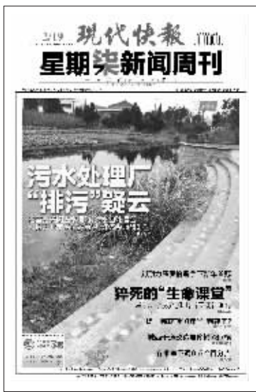
(上周星期柒新闻周刊封面)

人往高处走,水往低处流,每一个人都知道幸福什么,同时每一个人都都有追求幸福的权利。在一个现代社会,这种追求幸福的权利不仅不应该被遏制,而应该被尊重和鼓励。而户籍改革,就是对这种权利的认可和尊重。