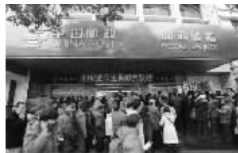
▲龙年邮票发行火爆,各地民众排队抢购

收藏热点五: 生肖邮票是国家的标杆藏品,新世纪一个龙年,龙票上涨指日可待,《龙邮大全》,升值潜力巨大!