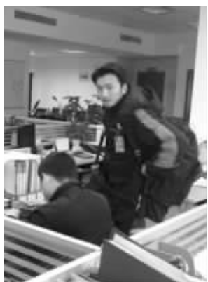
“谢霆锋”送快递 网络图片

快递收件也推出了帅哥服务?2月22日,有网友在微博上晒出一张快递员的照片,因为照片中的快递员长相酷似明星谢霆锋,迅速走红网络。接着,网友们在微博里掀起了寻找“快递谢霆锋”的热潮,据悉这名快递员是重庆人,网友调侃称:“他干不了几天快递了。”