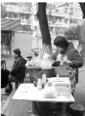
凌阿姨走红后,生意越来越好

最近无锡水秀新村一家粢饭摊子被微博网友热传,不少网友探访后大赞味道很好,把卖粢饭的凌阿姨叫做“粢饭大妈”。