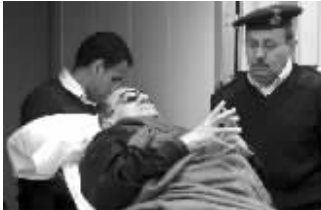
穆巴拉克受审资料图片

埃及法庭22日最后一次审理前总统穆巴拉克所涉杀害示威者案件。穆巴拉克当庭拒绝申诉。按西方媒体说法,他可能获判死刑。