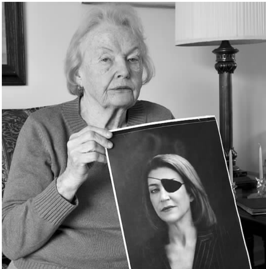
科尔文的母亲手捧科尔文的照片

被问及萨利赫今后的打算,贾纳迪说,萨利赫将继续担任全国人民大会党主席,“海合会协议没有禁止他(萨利赫)在两年后(总统选举时)作为候选人参选”。