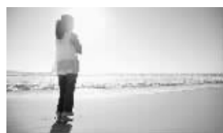
妇科微创手术,打败女性开腹恐惧症

子宫肌瘤、卵巢囊肿、宫颈疾病、婚后不孕……妇科疑难杂症带给女性的是身心的双重伤害。据南京454医院妇科微创中心专家介绍,该院开展的多类妇科微创手术,将子宫肌瘤、卵巢囊肿、宫颈疾病等妇科病的治疗列入“30分钟治疗圈”,微创手术以其高安全性和不开刀、不住院、创伤小、恢复快、术后感染率低等优势,解决了女性朋友的健康难题。