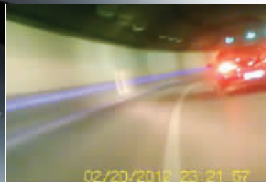
车载摄像头记录下的飞车瞬间 视频截图