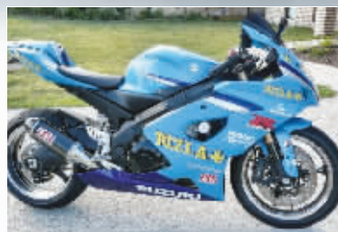
就是这辆摩托车