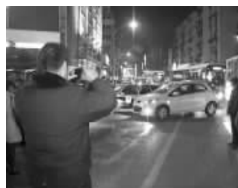
事故现场

昨晚, 马台街上发生一幕惨剧: 一辆白色轿车突然发狂似地横穿马路, 将一名走在路边的女子撞倒, 随后从她身上碾过, 最终该女子不治身亡。女司机说, 当时不慎将油门当成了刹车。