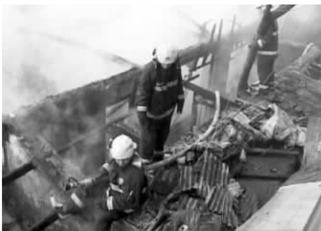
一排平房被烧毁