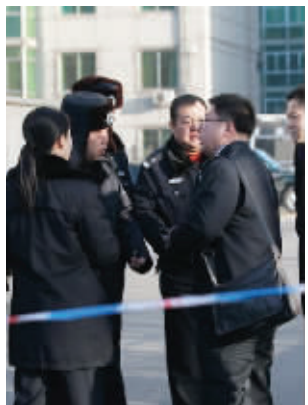
受审人律师与警察交涉