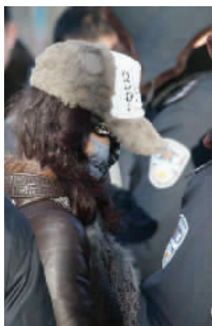
神秘女性家属抵达法院