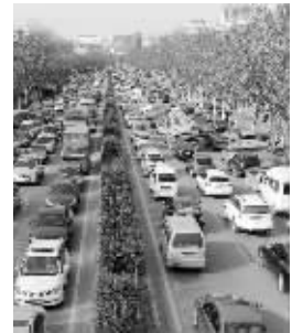
车水马龙的城西干道

哪些地方的树要迁移,迁移到哪儿,为什么要迁移……最新的方案中做了颇为详细的介绍。