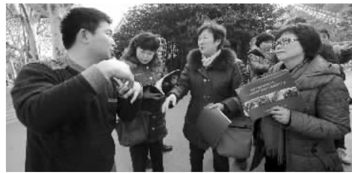
绿评员实地勘察树木情况

白下区总计行道树277棵,需迁移211棵。用于在建项目包括:石杨路道路绿化景观工程、雨花台区西善桥岱山西侧保障房项目。目前石杨路两旁光秃秃一片,正等待着树木的到来。秦淮区总计行道树189棵,需迁移152棵。主要迁移到绕城公路百里秦淮风光带(秦淮区段)绿地上。