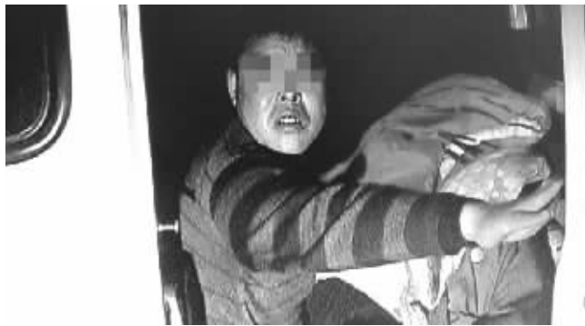
看渣土的人在车里睡觉

据了解, 为了监管随意倾倒渣土, 城管部门还在一些重要路段设置了岗亭, 以便加强监管力度。而这些岗亭里执勤情况又如何? 同样在怡康街, 土场里有一座蓝色小岗亭。一位老大爷开着取暖器, 盖着被子酣睡。他表示, 他和那名车里睡觉的保安是南苑街道委托一家物业公司过来帮忙看场地的, 防止有农用车、渣土车往土场或者路面上倾倒渣土。“我们从晚8点要干到早8点, 就是在这看着。我们没有执法权, 如果有人过来捣乱, 也只