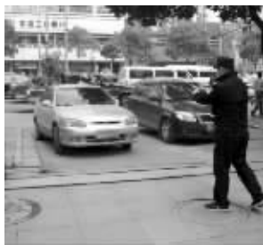
两辆车堵了门

昨天上午, 下关建宁路243号大院内下关疾控中心两名工作人员因停车纠纷, 用私家车堵了大院大门, 堵门3个多小时。导致大院内下关区妇幼保健所和下关医院两家单位车辆也无法进出, 医院急诊抢救通道出入口也被堵住, 最终在警察的干预下, 两人才把车移走。