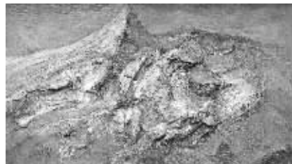
丁方油画《音符洒落山峰》