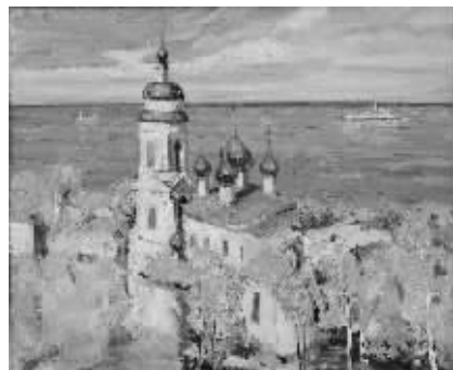
张华清油画《伏尔加河岸》