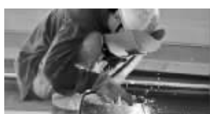
实际上我在干什么 作者:@比利_罗