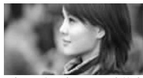
我是一名记者,父母眼中的我