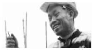
我学土木工程,父母眼中的我