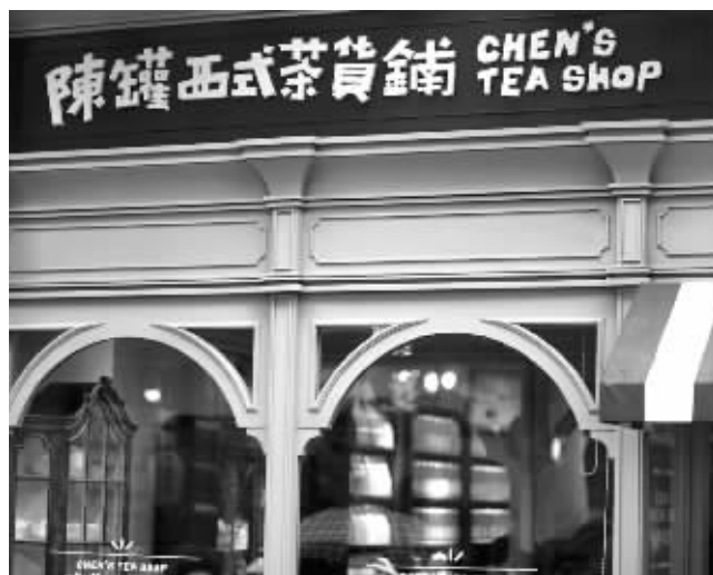
就是这家店铺引发网友造句

最“坑爹”的镇定中心: 高晓松恶搞好友宁财神,以他的名字为镇定中心命名为“宁财神病点击镇定中心”。