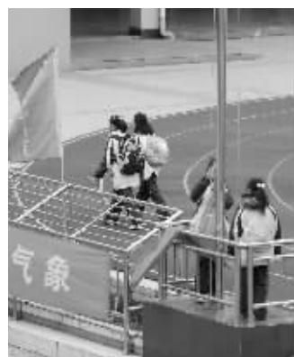
南京科利华中学是小升初报名热门学校

和年级的排名。“大家都知道‘成长脚印’都是按等级来的,没有一项具体分数,怎么排名?”她说,虽然有些班主任也给学生在班上悄悄排名,但年级排名绝对是不可能的,因为小学阶段排名不允许,学校也绝不会为学生出成绩排名的证明。“这样家长想给孩子填第几就填第几,还有意义吗?”