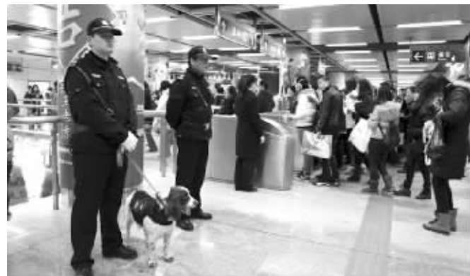
神勇又可爱的史宾格

昨天,一段“地铁搜爆犬专题片”经南京市公安局地铁分局官方微博晒出后,引发了网民关注。昨天,记者探访了地铁公安分局位于马群的警犬训练基地。