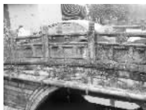
停在五龙桥上的车

桥确为文物保护单位,但这并不意味着桥上不能通行车辆,停放车辆不给桥身带来损伤的话,他们也无权干涉,但在路边停车涉及违停,他们将联合相关责任单位去现场了解情况后,再做进一步处理。