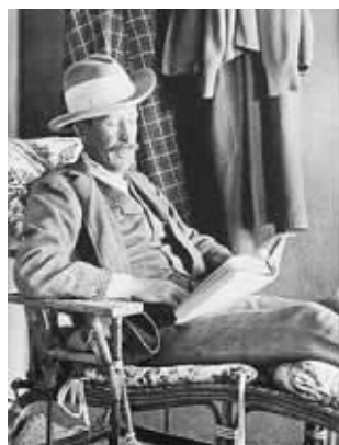
别墅首任主人卡纳冯勋爵