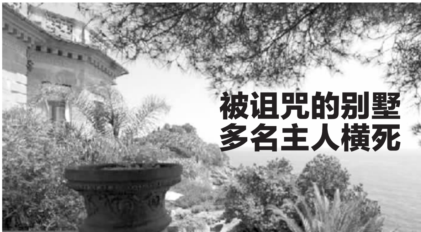
位于意大利地中海之滨的爱塔奇亚拉别墅