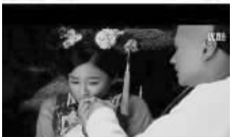
皇上你不割开大动脉就解不了渴!