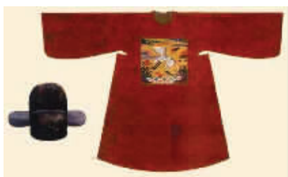
明代补服 资料图片

最近,有读者向《发现》周刊提出一个疑问,说南京市博物馆一个古代服饰展厅内的古代服饰有点儿怪,虽然样式很多,但衣服颜色却都是那种因为放久了而慢慢发黄的颜色,没有其他色彩。难道古代人穿的衣服都是这种暗黄色的?还是什么别的原因导致衣服只有这一种颜色?