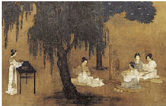
宋代《女孝经图》上的人物都穿有不同颜色的服装 资料图片