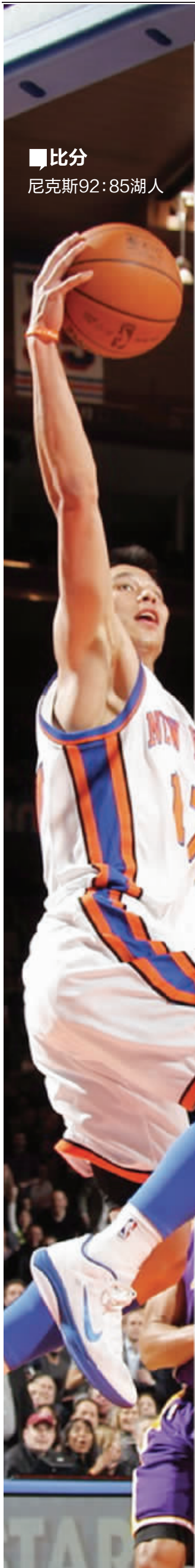
林书豪拿到38分和7次助攻