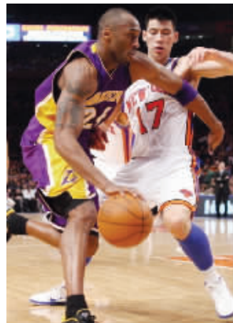
林书豪与科比正面交锋