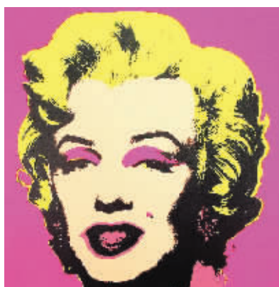
安迪·沃霍尔《玛丽莲·梦露》