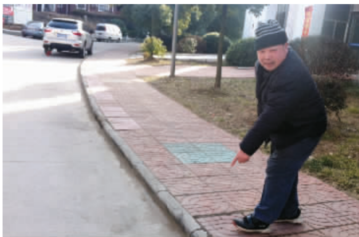
死者女婿称,这里就是事发地点