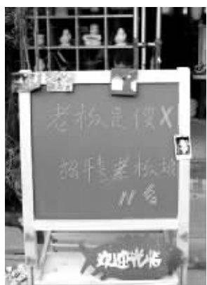
引人注目的招聘

婚啊。”网友“地上有钱”则表示惊奇:“征婚还要征N名?!”还有网友说:“这是一种吸引眼球和顾客的营销策略呀,顺便还能解决老板的个人问题。”