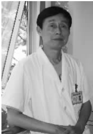
探访男科专家: 章如光教授

地址: 南京市汉中中路129号(地铁新街口站、上海路站下, 金鹰国际向西100米) 网址: www.njmlnk.com 健康咨询热线: 400-025-1992, 025-84711780, 52422222