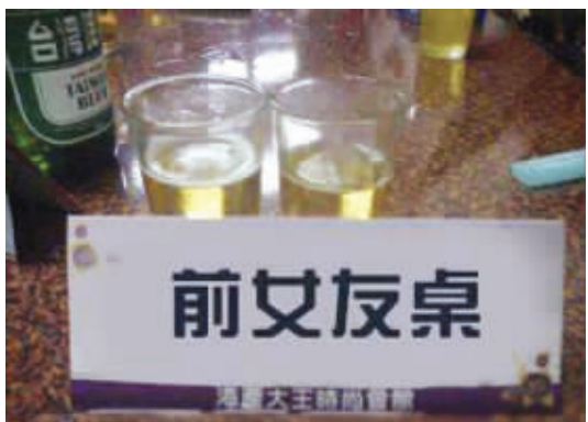
这桌可得多备些酒