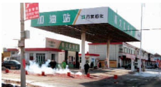
郭德纲说,这是在作死啊