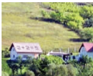
算错了还写这么大