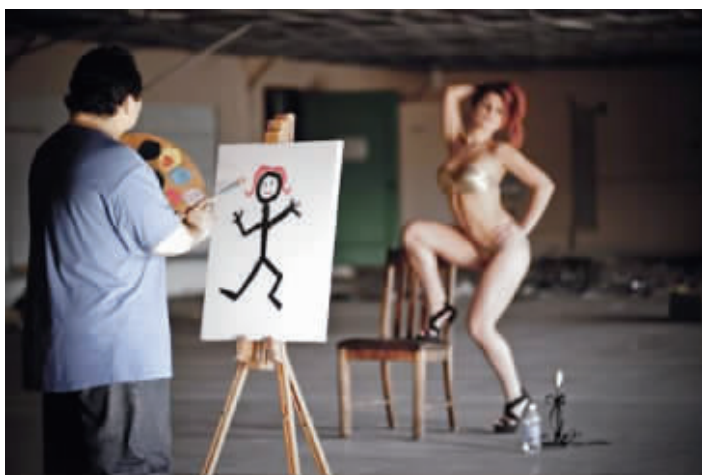
简约的抽象主义作品