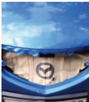
亲爱的,我把车修好了