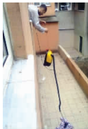
宅男是这样打扫院子的