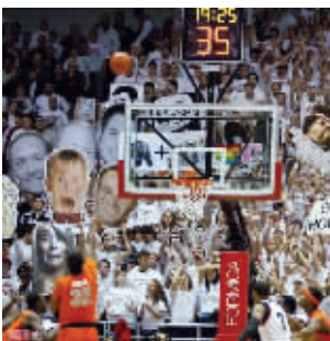
罚球要有一颗淡定的心