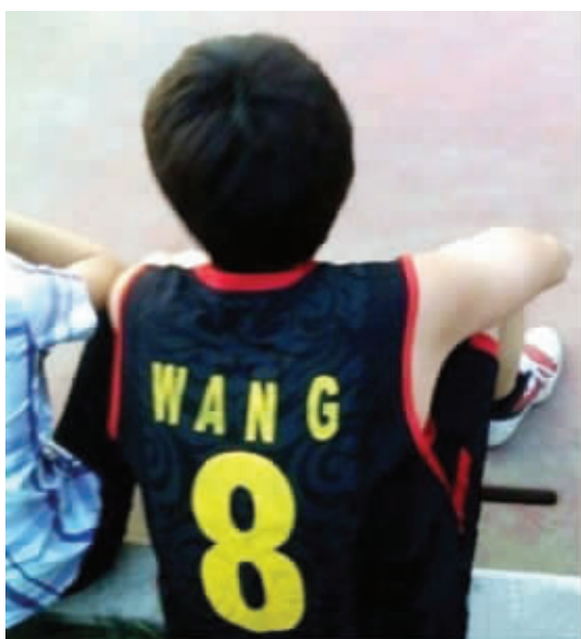
有时候选号码也得谨慎