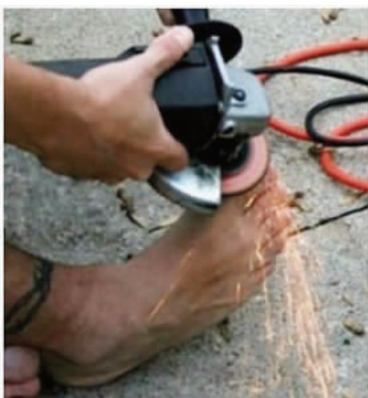
铁“趾”钢牙,你服不服