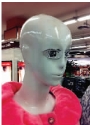
还是没眼睛的有气质一点