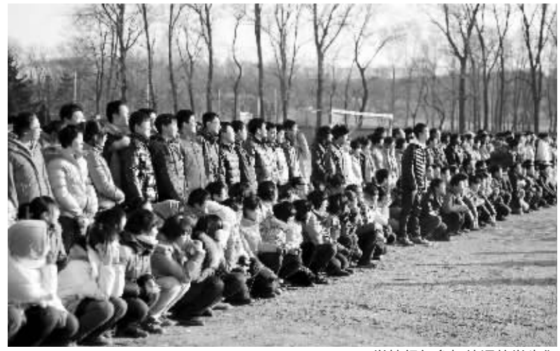
学校组织参加补课的学生们

负责人透露,“据公司财务自查,共有20-22亿的债务,但公司资产还有50-60亿,未出现资不抵债的情况。”该负责人同时介绍了包括将其在江苏盱眙的小太湖房地产项目抵给债权人等在内的四种偿还方案,并称将在4-5年内还清债务。3日下午,董顺生已被泰顺警方刑事拘留。 综合