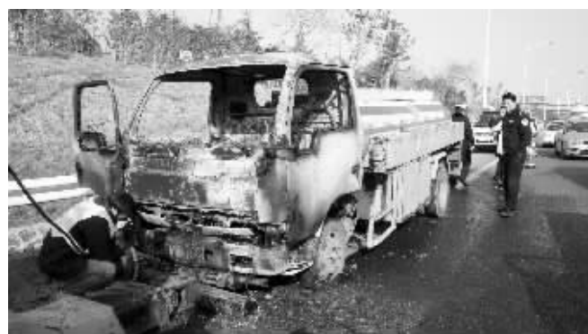
油罐车车头被烧成空壳

要是汽油,肯定就爆燃了。”现场一名消防指挥员称,柴油虽然燃点低,但不易挥发,需要与氧气充分接触后,才能燃烧。而此次