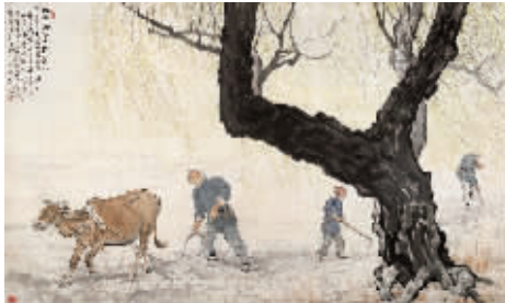
徐悲鸿 1951年作 九州无事乐耕耘 成交价2.668亿元 北京保利

中国古代书画是树立中国书画市场价格标杆的品类,以其稀缺性和艺术价值被称为艺术市场“硬通货”。2011年秋拍市场上,一方面拍卖行继续加大海外回流的力度,精品连连涌现,艺术家成交纪录屡屡得以刷新,另一方面总体流拍率较高,除了一些真伪难辨的古画以外,以往在拍卖市场通行无阻的《石渠宝笈》著录古画也遭遇流拍。这一季买家不仅仅关注拍品质量和来源出处,同时对估价偏高或换手频繁的拍品亦表现出谨慎的态度,进一步体现出买家对拍品性价比的要求。