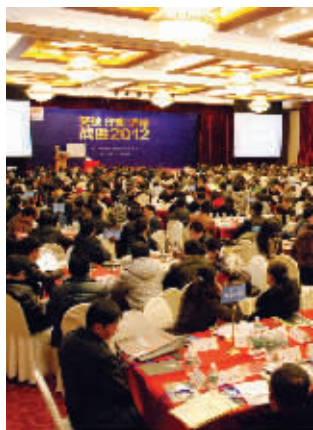
往届我乐橱柜经销商大会现场

据悉,借着2011年的强劲势头,龙头开年我乐便发力出招,“满一米送一米”的活动已经在南京以及全国正式登陆。我乐南京