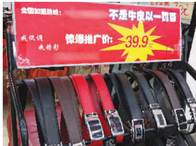
南京一家皮具店标明假一罚百

“假一罚十”是商家与消费者之间所形成的,这期间,商家作出了承诺,只要消费者存在购买行为,那么双方就形成买卖合同关系,‘假一罚十’就成为对双方都有法律约束力的一个条款。”南京市下关法院民一庭庭长夏雯说。夏雯庭长还为消费者提出了如下建议:“消费者看到‘假一罚十’的承诺时,首先就要看商家承诺的内涵到底是什么。”夏雯说,如果消费者主张权利,那就拿出足够的证据。