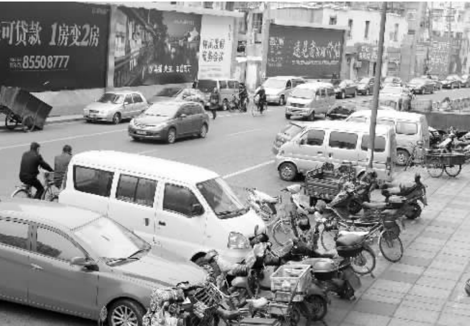
湖北路靠近湖南路路段,道路两侧违章停车现象严重