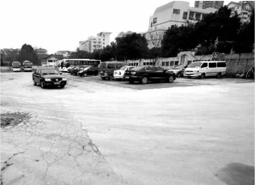
莫愁湖西停车场原本按次收费变成了计时收费后,私家车寥寥无几