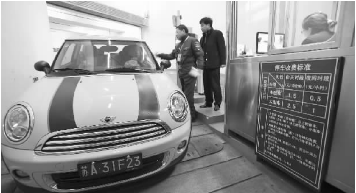
因自动收费系统还未升级到位的绿地中心停车场收费人员忙着手工开票