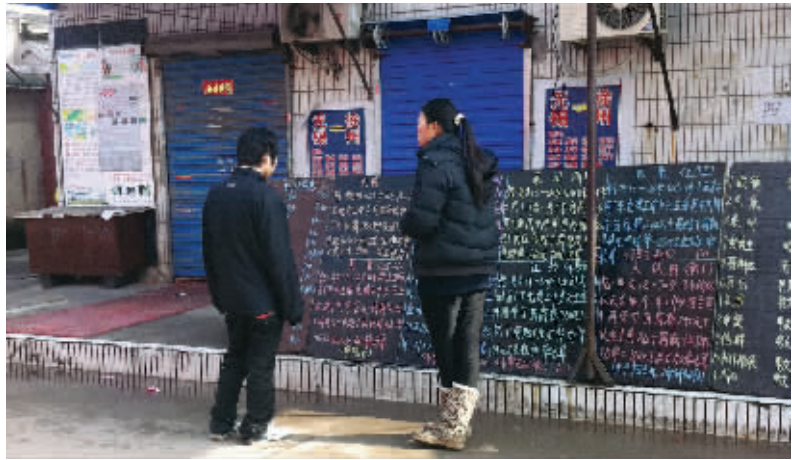
在春丰村里的一个客运公司门前,求职者在看“职介”发布的招聘信息