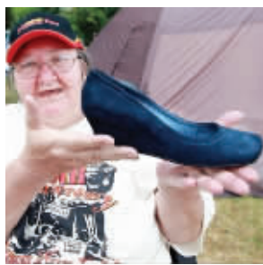
吉拉德跑丢的鞋子