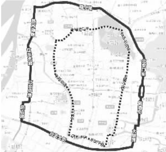
调整后的二级区域(实线)也向外扩了不少 制图 沈明