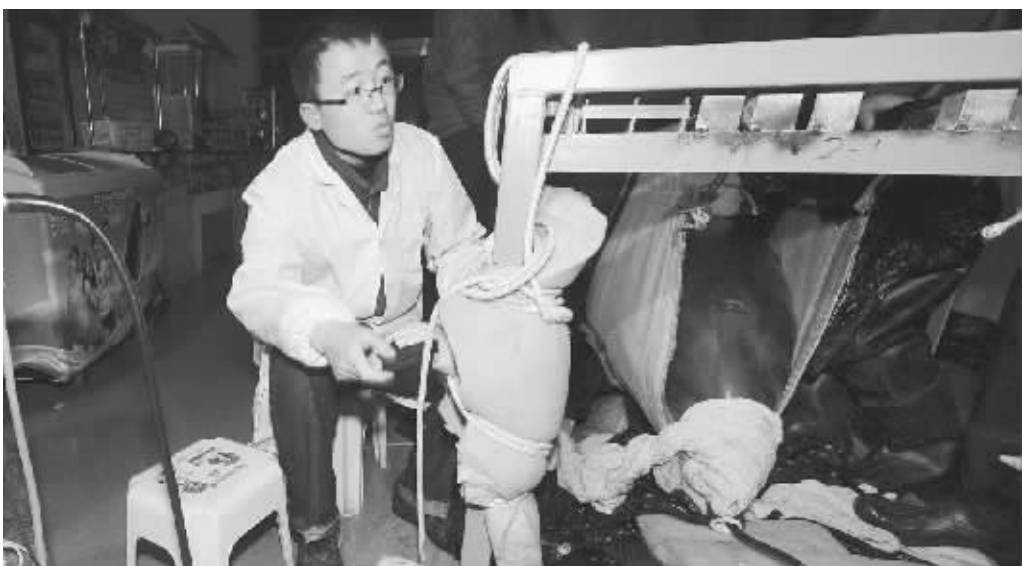
截至发稿时,海底世界的工作人员还在对海豚进行救治工作

医疗训练是海豚从小就要接受的训练之一。来南京前,江波就已经学会在训练师的指导下,自己主动上岸,并且翘起尾鳍让医生打针或挂水。因此,江波并没觉得有什么不对劲,乖乖地趴在岸上挂了两小时营养液。当然,海豚的皮肤娇嫩,其间为了保持皮肤湿润,要给它身上涂凡士林,不停地淋水,训练员还要轻柔地抚摸它,和它说说话,保持情绪稳定。