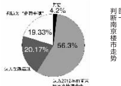
图一 判断南京楼市走势

对于购房人浓厚的观望情绪,开发商表示“压力山大”。业内人士指出,年后南京的开发商们面对资金链压力,可能会加快推房步伐,摸清购房者真实心理预期,也成为开发商的“必修课”。