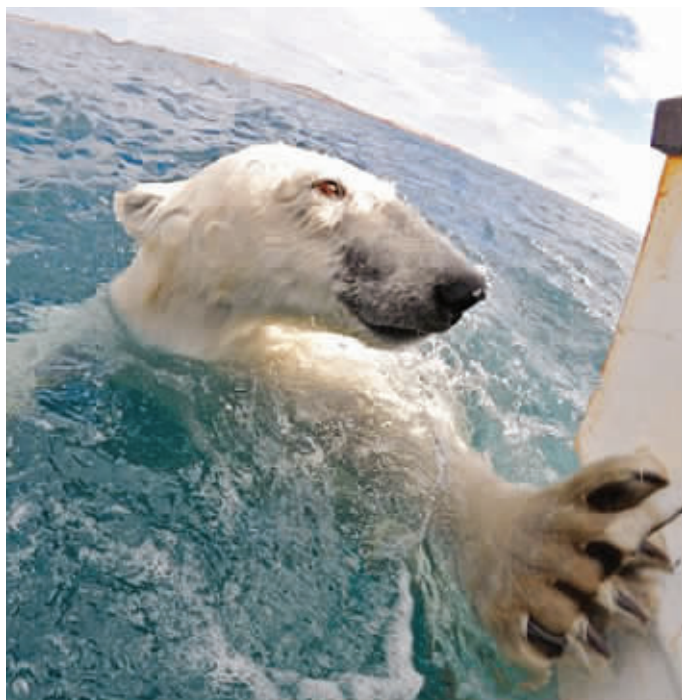
北极熊一掌拍向布尼的船