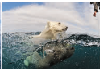
布尼试图和北极熊“套近乎”