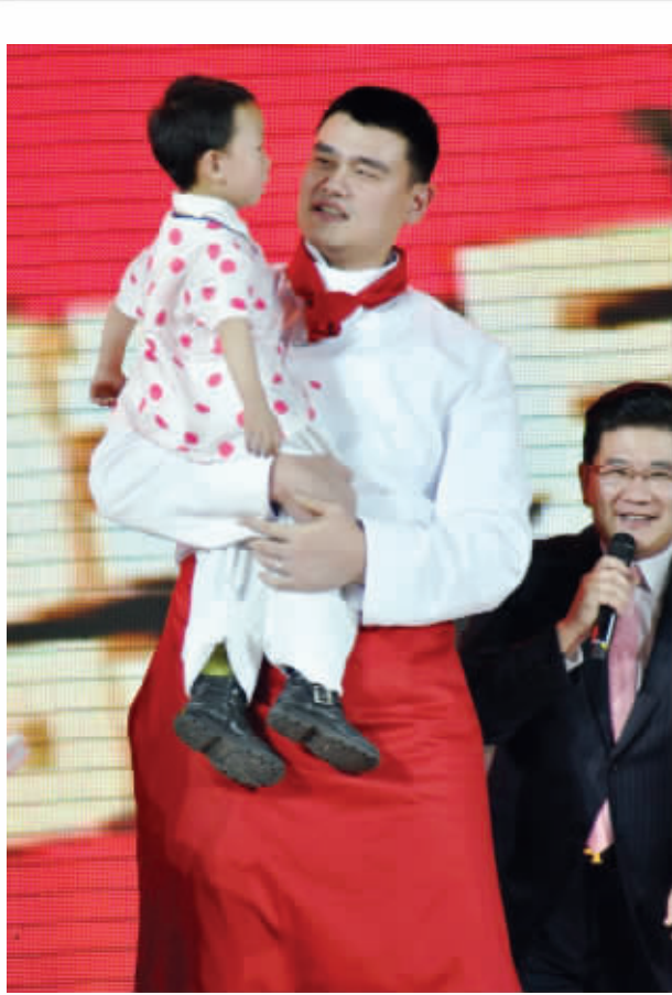
姚明化身厨师,录制海派春晚

这边奥尼尔以好似鲁智深的形象亮相,那边的姚明也同样以自己的全新身份出场:随着主持人一声“上菜喽!”,姚明跟着9位上海交通大学的师哥师姐化身大厨上场,身着厨师装的姚明带来的演出是让观众送上十道新年大餐,并在最后送上以篮球当汤圆,送上“十全十美”的压轴大餐。姚明还和小朋友合唱了歌曲。彩排结束后,姚明表示这是自己首次以学生身份参加春晚,别有一番感触,他特别感谢师哥师姐的照顾,同时他以学生身份给广大观众拜年:“祝愿大家合家安康,一切顺利!”由姚明参加的这台大戏将于1月23日大年初一晚上七点半播出。