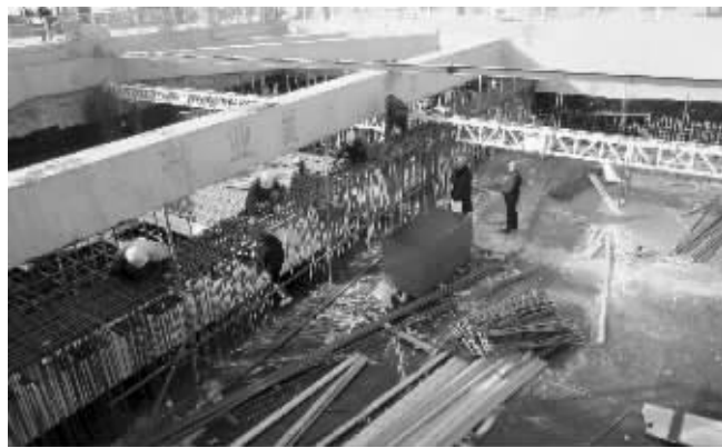
地铁2号线大王基站,工人正在紧张作业

记者从无锡市轨道办了解到,正在施工的无锡地铁1、2号线中,南北走向、全长30.5公里的地铁1号线,线路穿越惠山、北塘、崇安、南长、滨湖等五个城区,至2011年底,地铁1号线24个站点高架站土建施工已全部