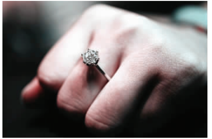
她要的并不是戒指,而是那一份爱的承诺 (图文无关)

喜感的笔盈盈: 前几天我老公他们单位年会,他也喝多了。回来以后躺在床上就开始说梦话,前半部分都是工作安排,听得我快笑死了。他偶然碰到了我的手,拿起来