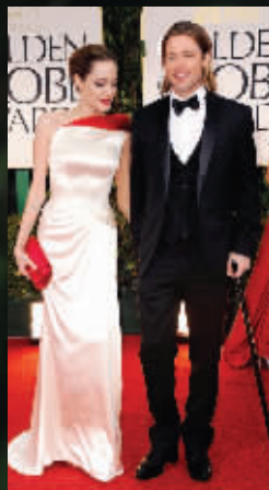
安吉丽娜·朱莉和布拉德·皮特这对明星夫妻成红毯上的焦点人物